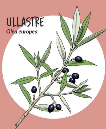
ULLASTRE Olea europea