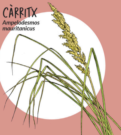
CÀRRITX Ampelodesmos mauritanicus