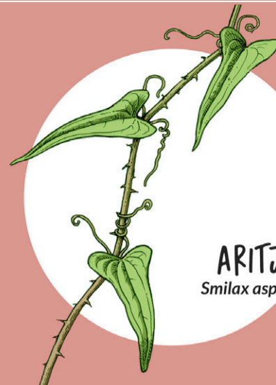
ARITJA Smilax aspera