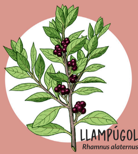
LLAMPÚGOL Rhamnus alaternus