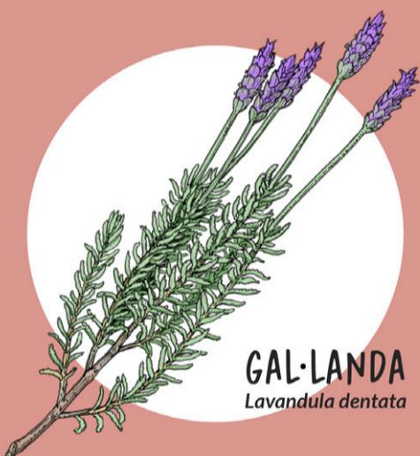
GAL·LANDA Lavandula dentata