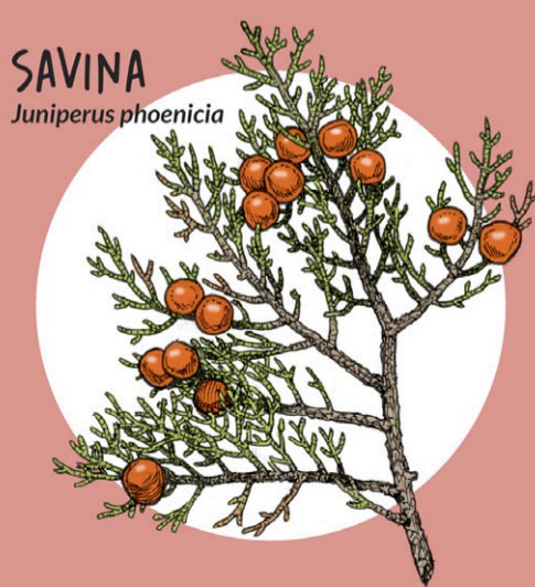
SAVINA Juniperus phoenicia