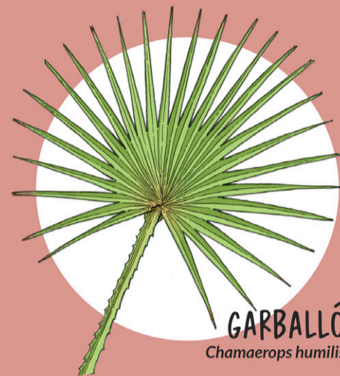
GARBALLÓ Chamaerops humilis