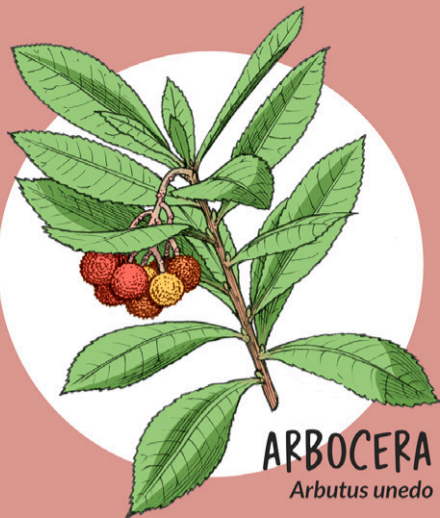
ARBOCERA Arbutus unedo