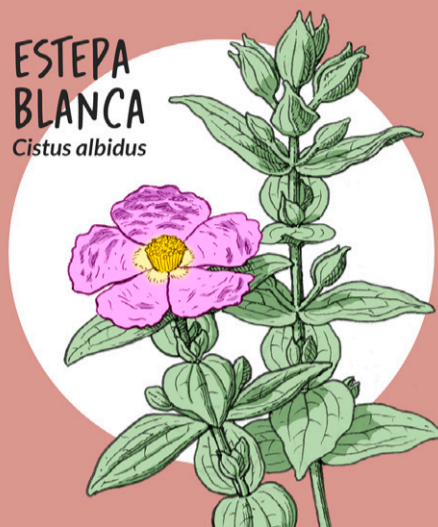
ESTEPA BLANCA Cistus albidus