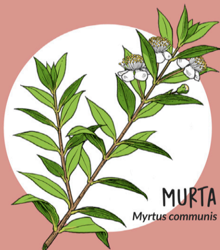
MURTA Myrtus communis