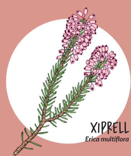
XIPRELL Erica multiflora