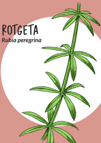
ROTGETA Rubia peregrina