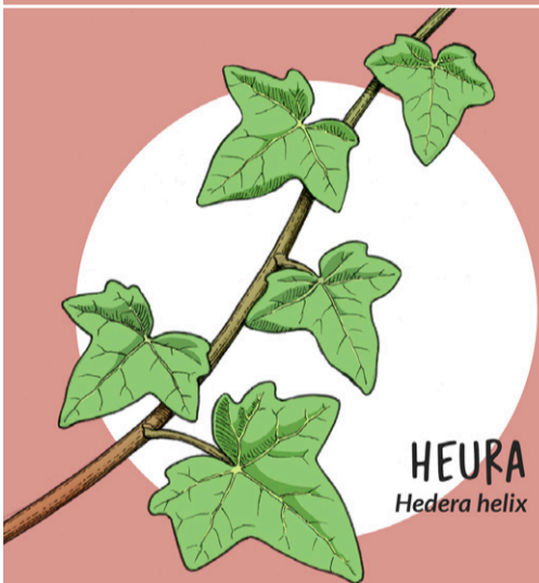
HEURA Hedera helix