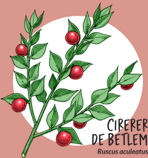
CIRERER DE BETLEM Ruscus aculeatus