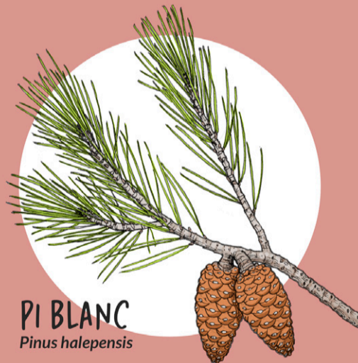
PI BLANC Pinus halepensis