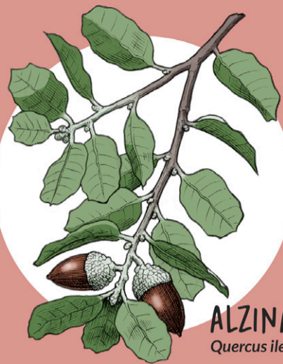
ALZINA Quercus ilex