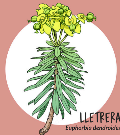
LLETREIRA Euphorbia dendroides