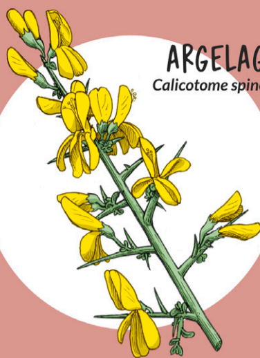
ARGELAGA Calicotome spinosa